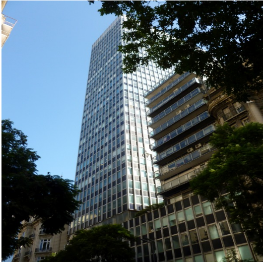
3. Edificio Olivetti, Buenos Aires