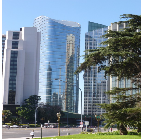
4. Torre Banco Macro, Buenos Aires

Actualmente esta búsqueda de sustentabilidad no se limita hoy solo a las envolventes en los edificios en altura. La arquitectura contemporánea debe asumir un rol activo y responsable con respecto a la buena administración de los recursos disponibles, tanto naturales como técnicos, económicos y humanos. La investigación en este campo representa una necesidad estratégica prioritaria y debería ser encarada de un modo integral e interdisciplinario.